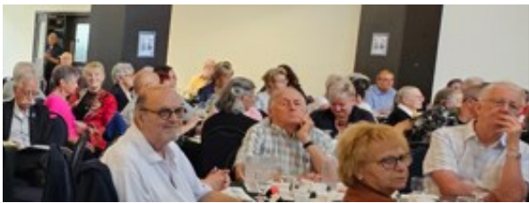
Participant.e.s à l'événement

Des représentants des Tables locales ont annoncé les activités prévues dans leur milieu pour l'occasion.