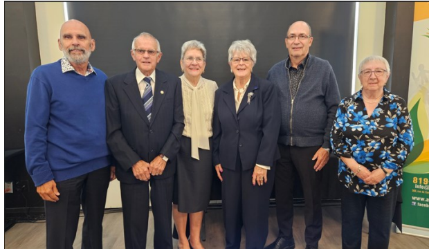
Nommé.e.s au Prix Hommage Aînés et Prix Reconnaissance Claude-Quintin